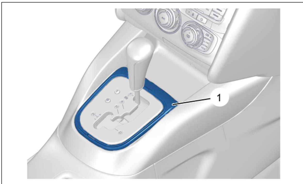
Рисунок : B2CM157D